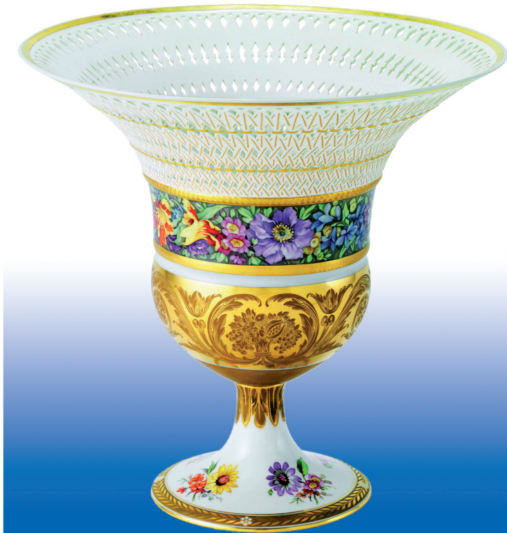
nach einem Entwurf von Karl Friedrich Schinkel, Berlin um 1820, Königliche Porzellan-Manufaktur, Berlin

Im Hotel Kolpinghaus Am Römerturm , St. Aperi-Straße 32 in 50667 Köln, Tel. 0221/20930 können Sie ein EZ zum Preis von 140,00 € inkl. Frühstück bis 5. Oktober 2009 buchen. Ein weiteres Abrufkontingent im NH Hotel Köln City , Holzmarkt 47 in 50676 Köln, Tel. 0221/2722880 eingerichtet. Das EZ kann für 197,00 € inkl. Frühstück bis 18.10.2009 gebucht werden.